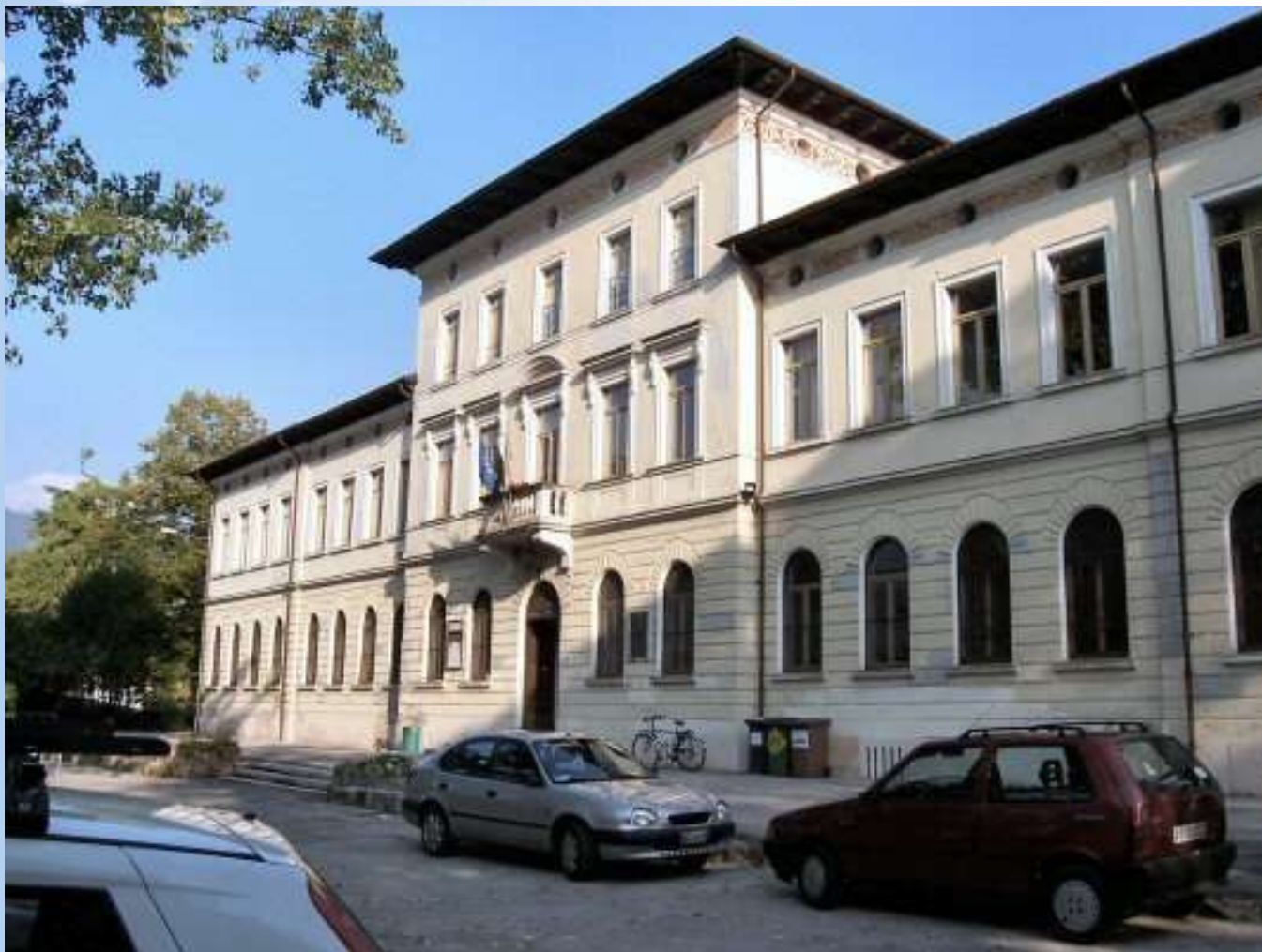
La sede del Liceo